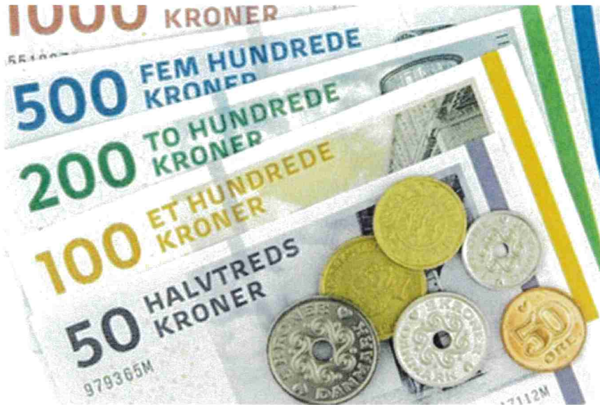
billede af kontanter

Bestyrelsen for Brønderslev Varme A/S har på et møde besluttet, at prisen for fjernvarme sættes op. For-syningen har efter et halvårsregnskab, der gav indikationer om et negativt resultat, overvåget situationen og fundet at forskellige faktorer for varmeåret 2025 tilsiger, at det er nødvendigt med en prisstigning. Tillige skal et forventet underskud (underdækning) for 2024 indregnes i taksten for 2025.